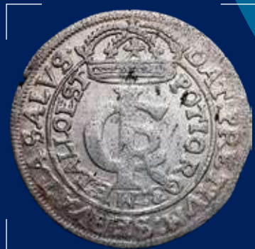
Речь Посполитая, Ян II Казимир. Златовка (30 грошей), 1663 г., серебро

Ныне украинцы — значимая часть населения Приднестровья, а украинский язык входит в число официальных.