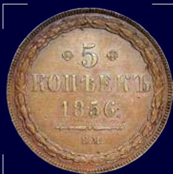
Российская империя, Александр II. 5 копеек 1856 г., медь

Приднестровье является небольшой частью огромного восточноевропейского пространства, которое ромы считают своим домом.