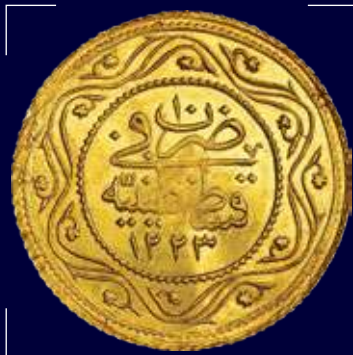
Османская империя. Махмуд II. 1 алтын 1817 г., золото. Ювелирные изделия по образцу этих монет использовались в 19 веке как традиционное украшение гагаузских невест

Сейчас гагаузы пятый по численности этнос в Приднестровье. В День святого Георгия гагаузы широко отмечают народный праздник Хедерлез, который означает наступление лета, когда можно выводить стада на пастбища. На праздник принято готовить гагаузские блюда – булгур, каурму. Гагаузские традиции производства брынзы успешно используют на овечьей ферме в приднестровском селе Мочаровка.