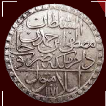
Османская империя, Муштафа III. Монета 60 пар (2 Золота) 1758-1772 г., серебро