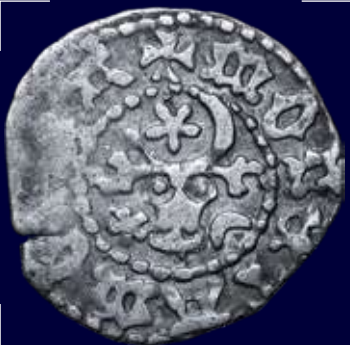
Молдавское княжество, Стефан III Великий (Штефан чел Маре). Монета 1 грош 1457 г., серебро

Неотъемлемыми атрибутами приднестровских праздников и сейчас традиционно остаются молдавское вино и зажигательные молдавские танцы.