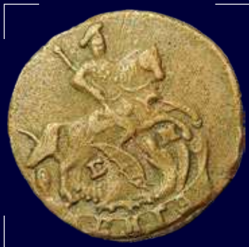
Российская империя, Екатерина II, Деньга 1794 г., медь

Армянские жители Приднестровья славились купечеством, мастерством выделки сафьяновой кожи и успешно занимались хлебопашеством и плодоводством. Недавно Григориополю был возвращен исторический герб, который почти точно повторяет изобретённый в XVIII веке «герб Царства Армянского». Это служит напоминанием об армянской истории города.