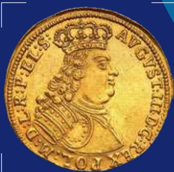
Речь Посполитая, Август III. Монета Дукаг 1734 г., золото

Значимым для евреев местом в Приднестровье является Рашков, где проповедовал известный талмудист Шабтай и расположена старейшая синагога. Нередко евреи испытывали гонения, но природная жизнестойкость позволяла сохранять созидательное начало. В XIX-XX веках евреи составляли значимую часть городского населения Приднестровья.