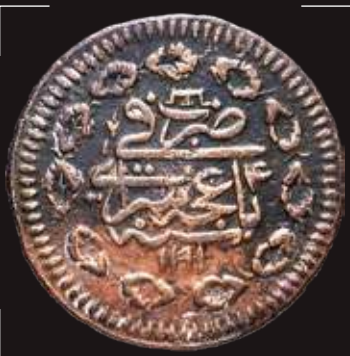
Крымское ханство, Шахин Гирей, 3 Акче (1 Колейка), 1780 г., бронза

С присоединением нашего края к России ногайские татары его покинули, а ныне память об их пребывании сохранилась в географических названиях Ягорлык, Ташлык, Карагаш и др.