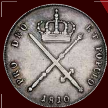
Германия, Максимилиан I Иосиф. Кроненталер 1810 г., серебро

День святого Мартина в Германии большой праздник. Его отмечают все конфессии. По улицам разгуливает Святой Мартин в образе римского воина. Взрослые жарят гуся, дети важно шествуют со светящимися фонариками, чувствуя доброту и милосердие.