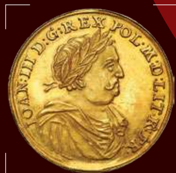
Речь Посполитая, Ян III Собеский. 2 Дуката 1674 г., золото

Старинный Рашков оставил свой след в польской национальной памяти благодаря роману Г. Сенкевича «Пан Володыёвский». Наш край описан, как беспокойная граница христианского мира в период восстаний и войн второй половины XVII в., когда полякам и другим жителям приднестровского Подолья приходилось отстаивать свою свободу и образ жизни. И в наши дни сохраняется обычай на Миколайки — в день Святого Николая дарить подарки и детям, и взрослым.