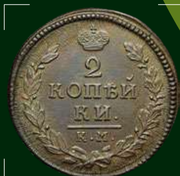
Российская империя, Александр I. Монета 2 копейки 1817 г., медь

В сентябре наступает пора сбора винограда и время, когда отмечают праздники большой родины — День воссоединения и День независимости Болгарии.