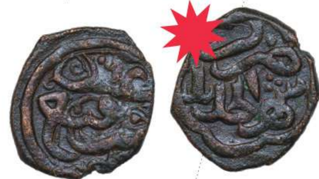
Золотая Орда. Анонимный пул города Шехр ал-Джадида. Медь. 1364/1365 г.

Абдаллаха. Какие вехи побудили к таким переменам – междоусобица или эпидемия чумы? Это пока остается загадкой. Волею судеб поднепровский край, пусть на короткое время – в 60-е годы XIV века – становится значимым центром монгольского государства. В Старом Орхее искусные приезжие мастера строят мечеть, караван-сарай, общественные бани, делают глиняную посуду, изделия из кожи и собственную городскую монету.