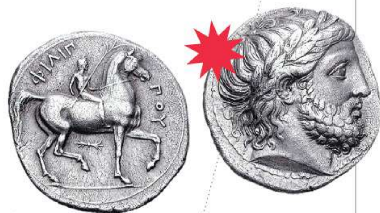
Македония. Филипп II (359-336 гг. до н.э.). Тетрадрахма. Серебро

монеты и другие блага греческой цивилизации хорошо прижились и стали привычными в обиходе. Даже в чеканке собственных монет варвары старались повторить красоту македонских серебряных драхм с изображением Зевса и всадника.