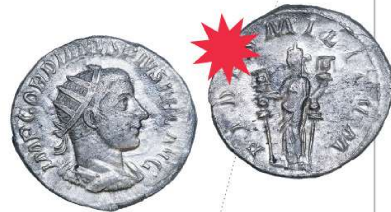
Гордиан III. Антониниан. Серебро. 242-244 гг. н.э.

стве с Римской империей и всеми ее благами стали основой для развития племен Черняховской культуры. Люди занимались земледелием, гончарным делом, ткачеством и даже металлургией, а для расчетов использовали монеты могущественного соседа. Такой уклад жизни благоприятствовал достатку и накоплениям. Но нашествие гуннов в конце IV в. уничтожило множество поселений черняховцев, а находки кладов выдают попытки их владельцев сохранить свои сбережения.