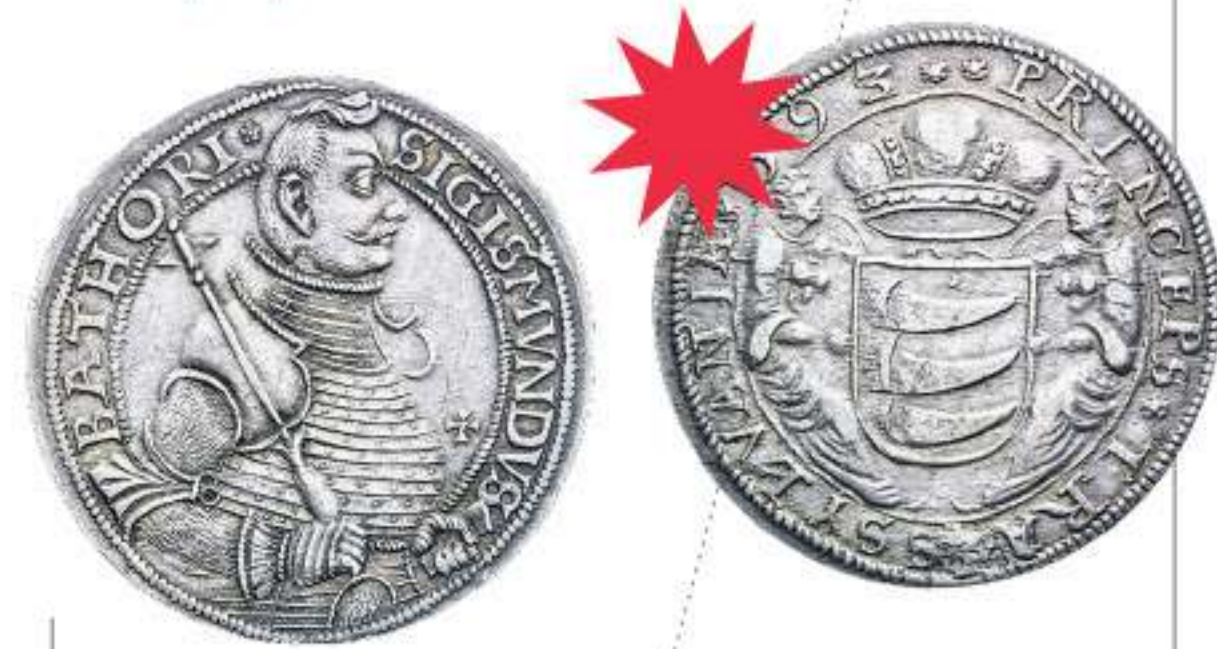
Княжество Трансильвания Сигизмунд Баторий. Талер. Серебро. 1592 г.

лапах, его называли левендаальдер или львиный талер. Монета была настолько популярна, что львами стали называть любую крупную монету. Отсюда леи в Валахии и Молдове, левы - в Болгарии. Неудивительно, что талеры попадают в местных кладах. Так в приднестровском Карагаше в 1959 году были найдены сотни серебряных монет разных стран, среди которых и голландские талеры.