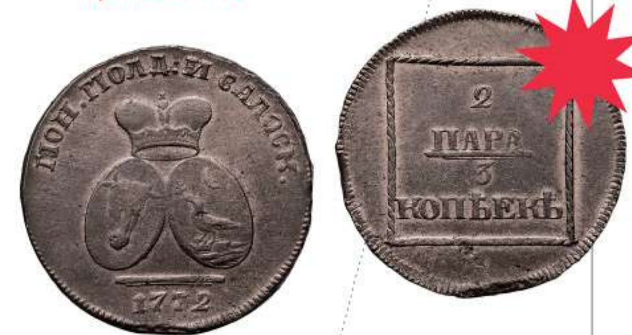
Российская империя. Екатерина II. Монета для Молдавии и Валахии. 2 пара – 3 копейки. Бронза. 1772 г.

и фураже. Для расчетов с местным населением было решено выпускать специальную монету, где номинал для удобства обозначался русскими копейками и турецкими пара. После взятия Бендер в распоряжении Румянцева оказались трофейные турецкие бронзовые пушки.