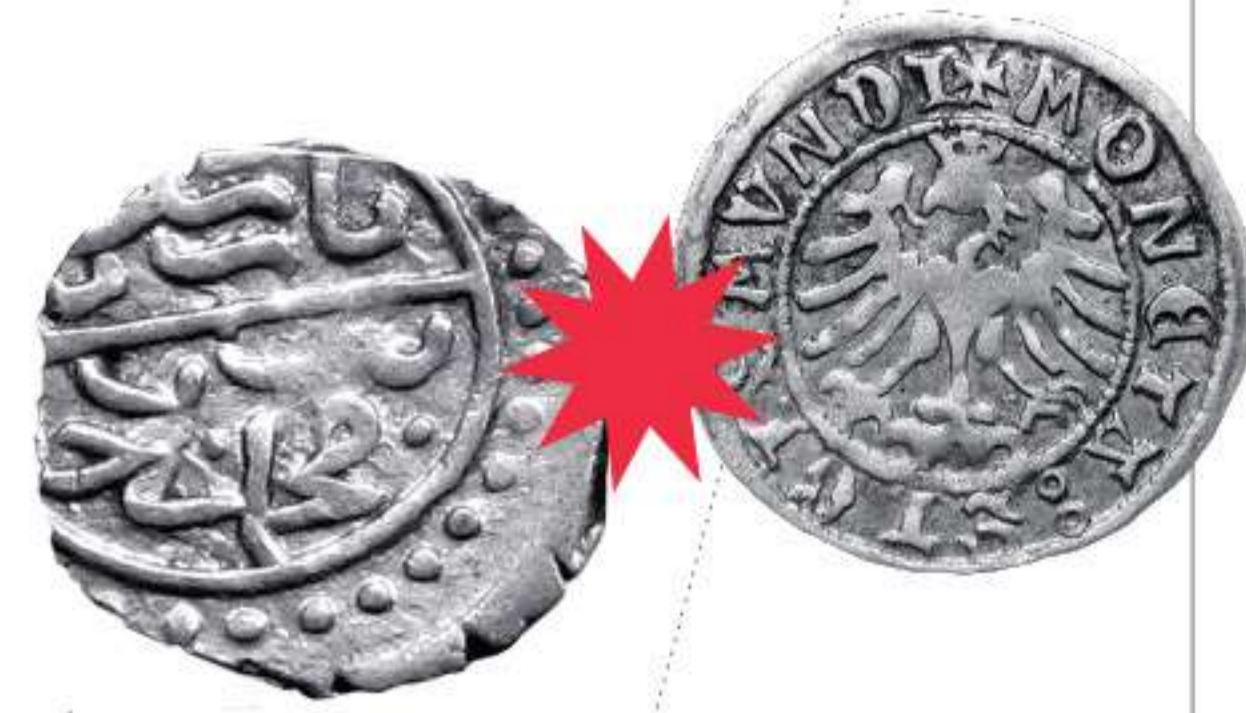
Османская империя. Баязид II Акче. Серебро. 1481 г. / Великое княжество Литовское. Сигизмунд I Полугрош. Серебро. 1509 г.

монеты в полгроша с изображением скачущего всадника, и польские с орлом. Встречалась и другая серебряная монета – молдавские гроши, венгерские денарии, крымские аспры.