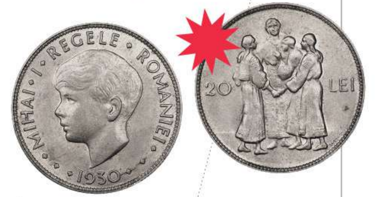
Королевство Румыния. Михай I. 20 леев. Латунь. 1930 г.