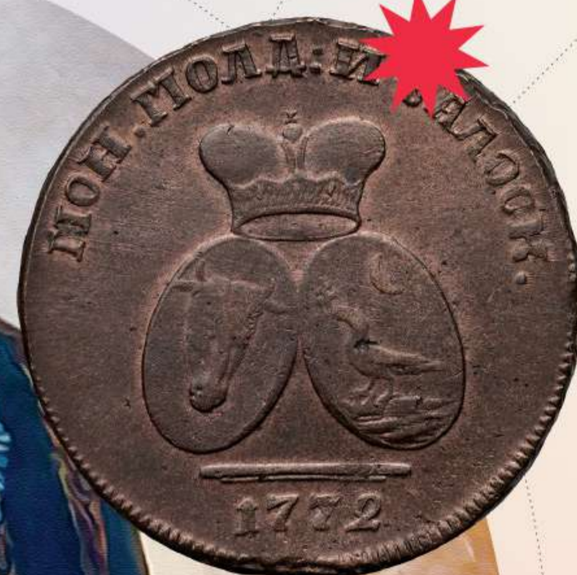
Русская медная монета для Молдавии и Валахии, которую могли сделать из турецких орудий Бендерской крепости