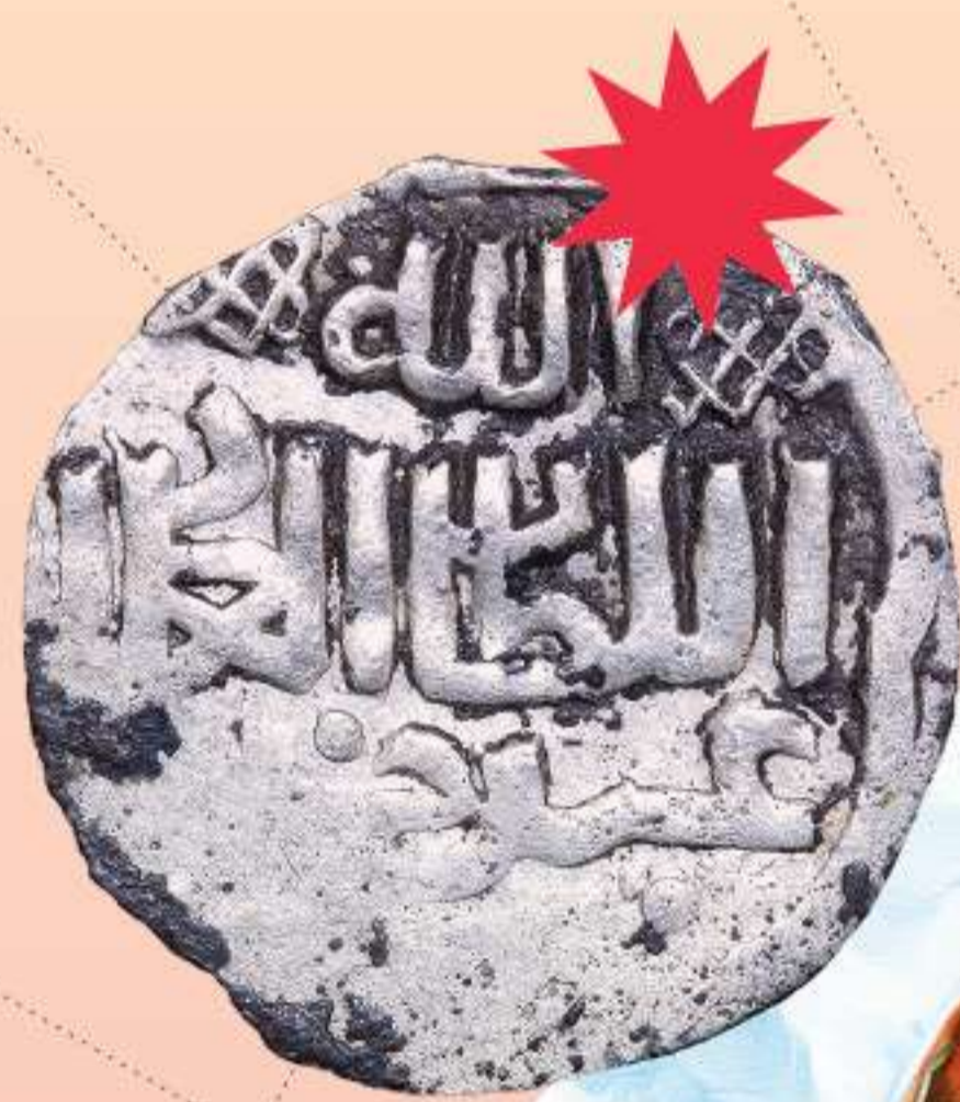
Золотая Орда. Абдаллах-хан. Йанги-Шехр. Данг. Серебро. 1363/1364 г.

Абдаллаха. Какие вехи побудили к таким переменам – междоусобица или эпидемия чумы? Это пока остается загадкой. Волею судеб поднепровский край, пусть на короткое время – в 60-е годы XIV века – становится значимым центром монгольского государства. В Старом Орхее искусные приезжие мастера строят мечеть, караван-сарай, общественные бани, делают глиняную посуду, изделия из кожи и собственную городскую монету.